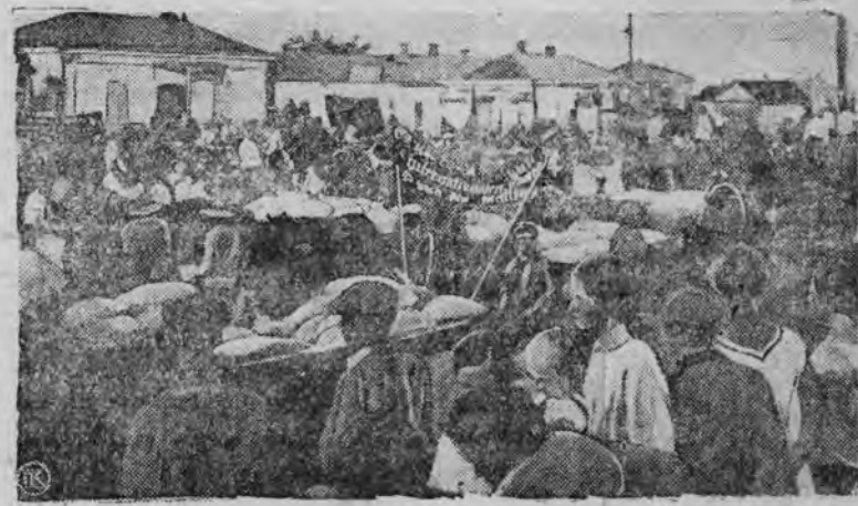
Колхозники, бедняки, середняки, 7-го ноября всеобщий районный хлебный обоз.